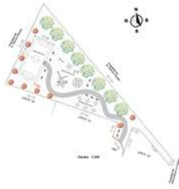
Cesión de Área Verde